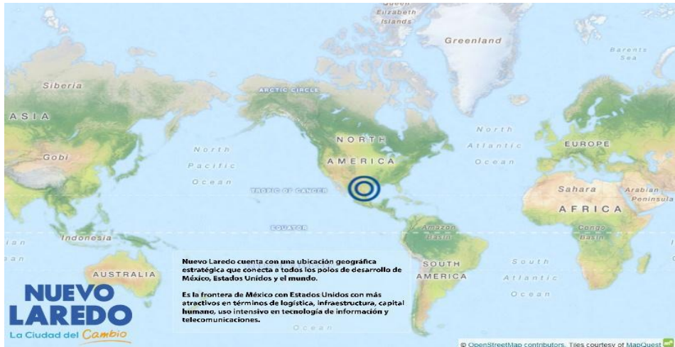
Figura 3. Ubicación de Nuevo Laredo en el mundo