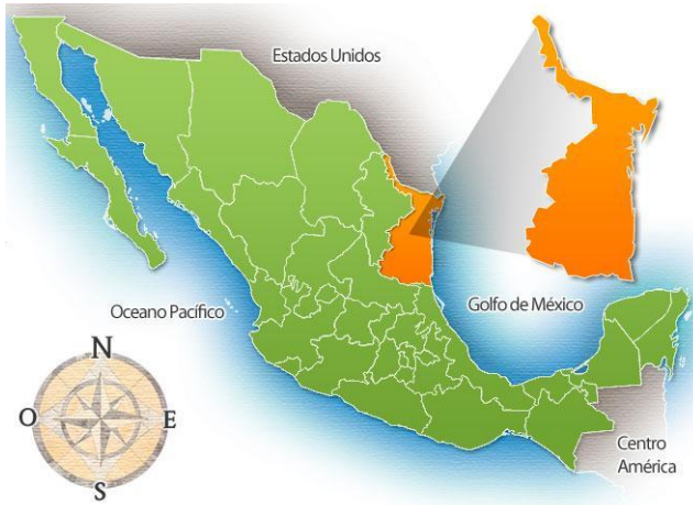
Figura 1. Ubicación de Tamaulipas, México